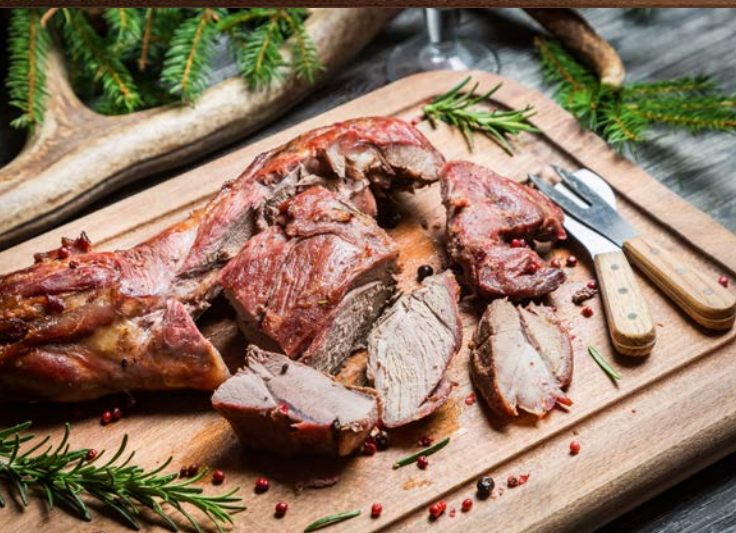
Wild, wilder, Willeckes Wildbuffet