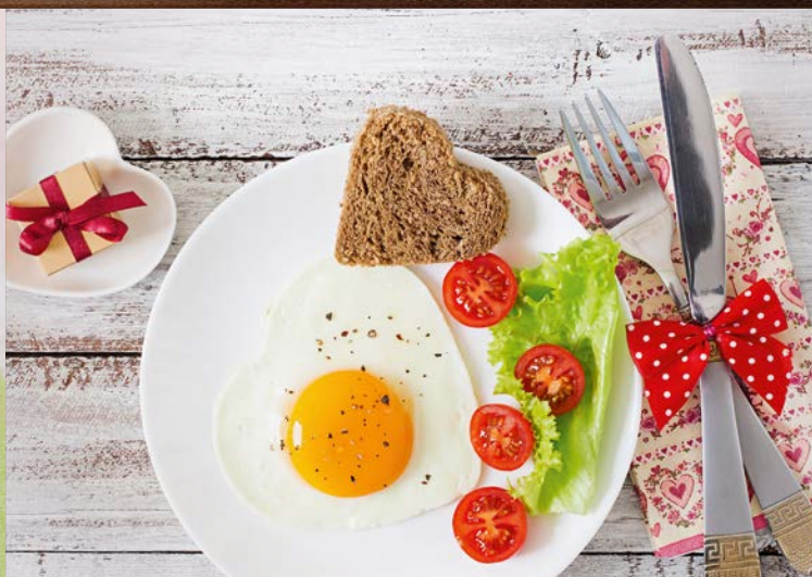
Futtern mit Muttern