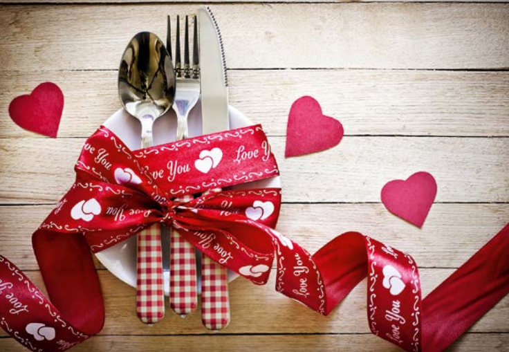
Für Turteltäubchen ...