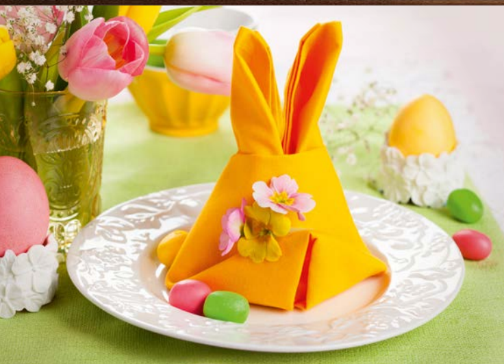
Schluss mit Fasten!