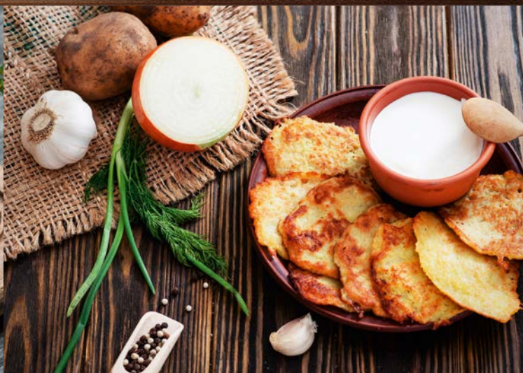
Glänzend im November*

Frisch aus Wald und Feld: Wenn es draußen langsam kalt und frostig wird, wird's bei uns deftig. Freuen Sie sich auf „wilde“ Köstlichkeiten vom Wildschwein, Hasen, Reh und Co. –