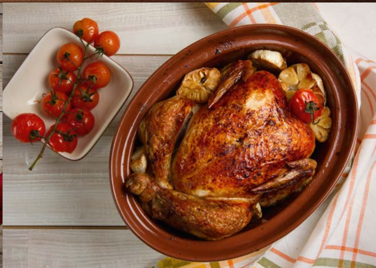
... und Hähnchenfreunde